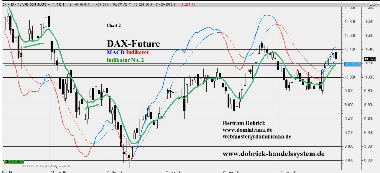
Chart 2: www.dominicana.de/DAX_Chart-2_examples.pdf Chart 3: Wolkenchart / Ichimoku-Chart / chart / grafico Ichimoku / Ichimoku-Chart / chart / grafico Ichimoku